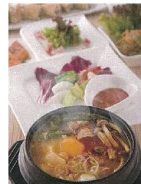
<12F 東京純豆腐 >