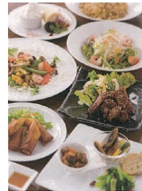
<13F HAKATA ONO >